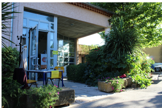
Entrée de la médiathèque Montmajour

Les enfants assis regardent le devant de la scène, attendant avec impatience que la magie opère, puis la lumière s'éteint et le rideau s'ouvre.